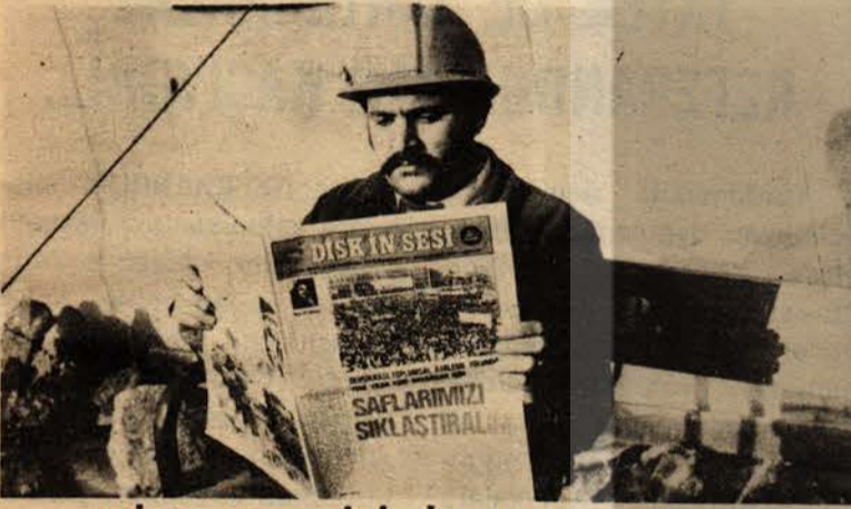
DİSK DERGİSİNİ OKU, OKUT

EMEKÇİ HALKIMIZIN ZOR DURUMDA OLAN BELEDİYE İŞÇİLERİ VE BELEDİYELERİN YANINDA YER ALACAĞINA İNANIYORUZ.